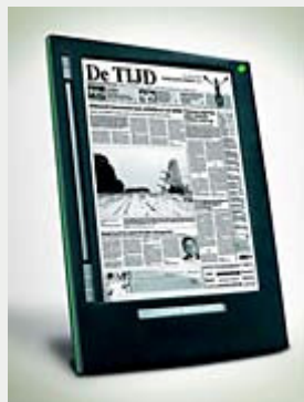
Armin Talke Staatsbibliothek